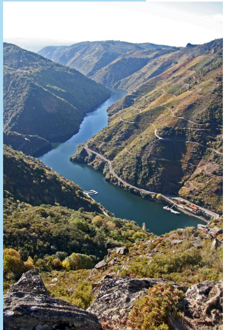
O Sil desde as Penas de Matacás en Paradela (Castro Caldelas).