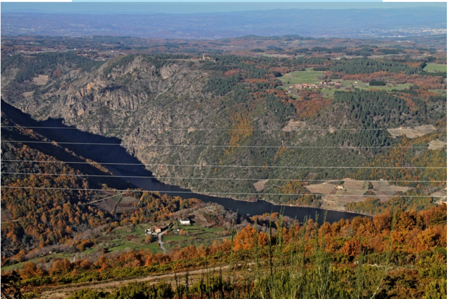
Vista desde a ermida de Trigoás.