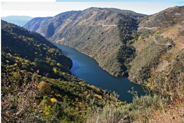
Vista desde Lumeares (A Teixeira).