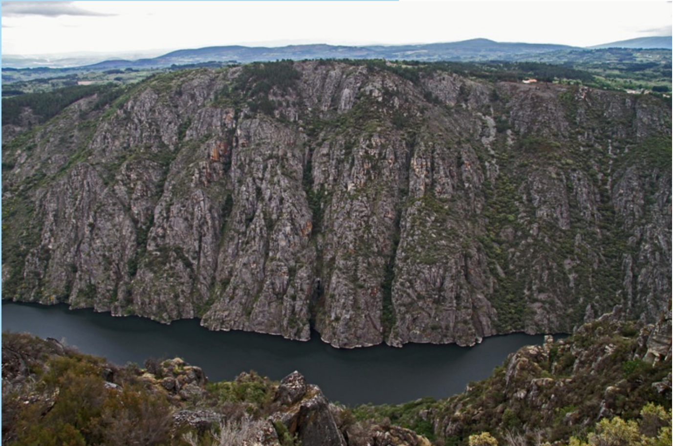
Paredes do canón na zona do santuario das Cadeiras desde o miradoiro das Torgás en Parada do Sil.