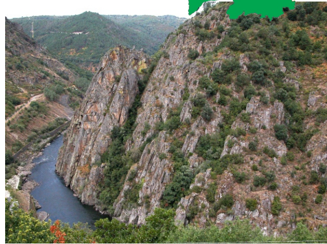
Vista do cantil de Nogueiro desde a Central de Santo Estevo (Nogueira de Ramuín).