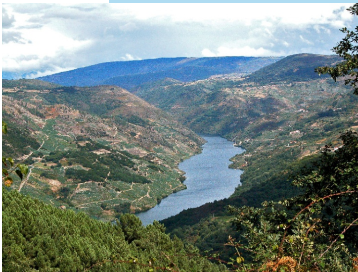
O Canón do Sil en Cristosende.