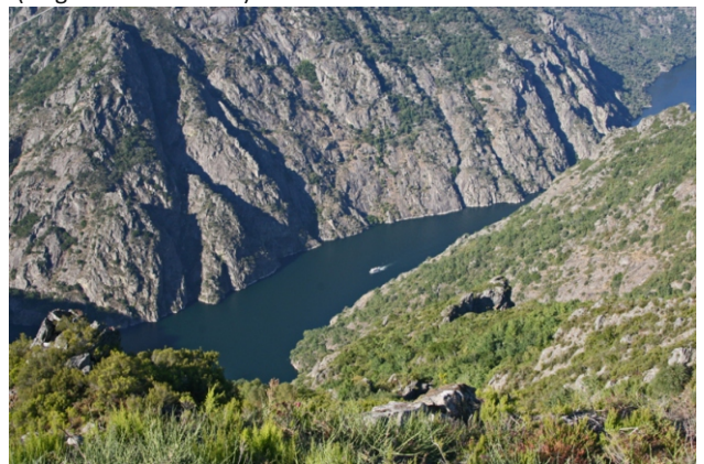
Canón do Sil desde o mirador das Gándaras (Parada do Sil).

Unha viaxe por un dos espazos naturais máis emblemáticos do país, nunha área dun grande interese xeolóxico e paisaxístico, polas impresionantes formacións rochosas que se aprecian desde diferentes lugares, que nalgúns puntos acadan os 500 m de altura, con paredes case verticais; ecolóxico pola mestura de especies atlánticas e mediterráneas, a presenza de bosques autóctonos e de zonas remansadas creadas polos encoros onde se pode ver unha interesante avifauna; sen esquecer os valores histórico-artísticos e etnográficos. Todo este tramo do canón está protexido no LIC “Canón do Sil” e forma parte da área vitivinícola acollida á denominación de orixe protexida “Ribeira Sacra”.