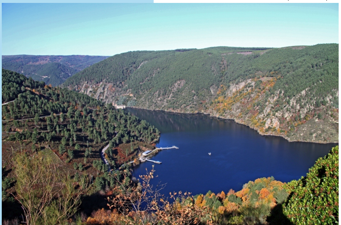
Encoro e embarcadorio de Santo Estevo desde a estrada que sube a Loureiro (Nogueira de Ramuín).

Un percorrido lineal, en coche, con pequenas camiñadas, pola ribeira ourensá do Canón do Sil ao longo dos concellos de Nogueira de Ramuín, Parada do Sil, A Teixeira e Castro Caldelas, desde Os Peares ata o miradoiro de Matacás. Pódese acceder desde moitos puntos, pero nós propoñemos un percorrido case lineal.